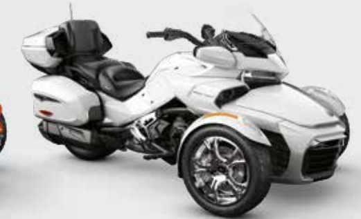
BLANC PERLÉ* Édition Chrome