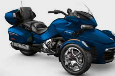
NOIR ACIER MÉTALLIQUE* Édition Chrome