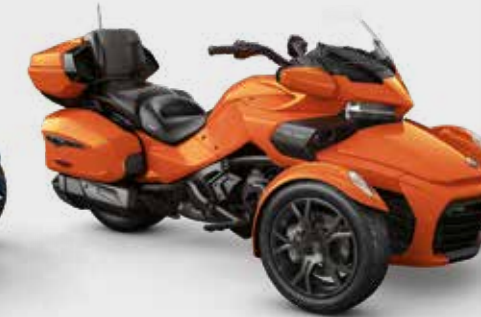
ORANGE PHOENIX MÉTALLIQUE* Édition Noire