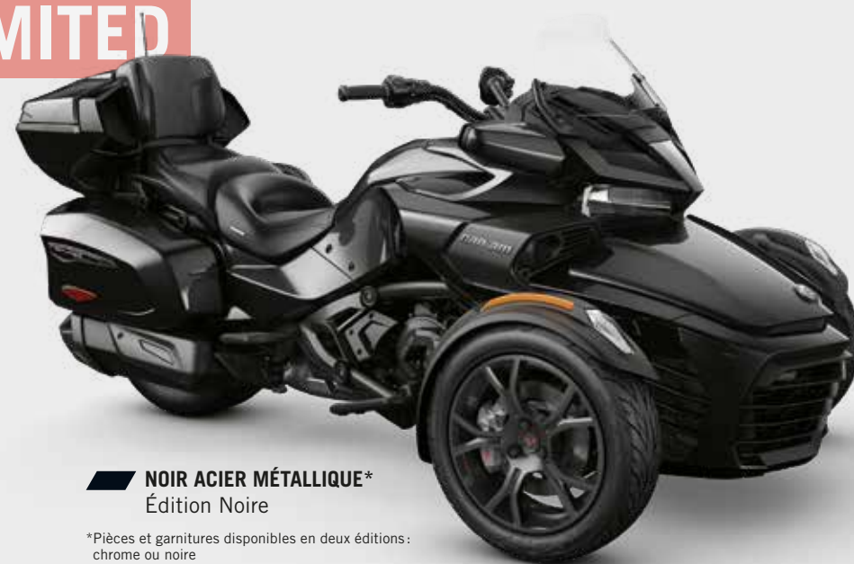
NOIR ACIER MÉTALLIQUE* Édition Noire

*Pièces et garnitures disponibles en deux éditions: chrome ou noire