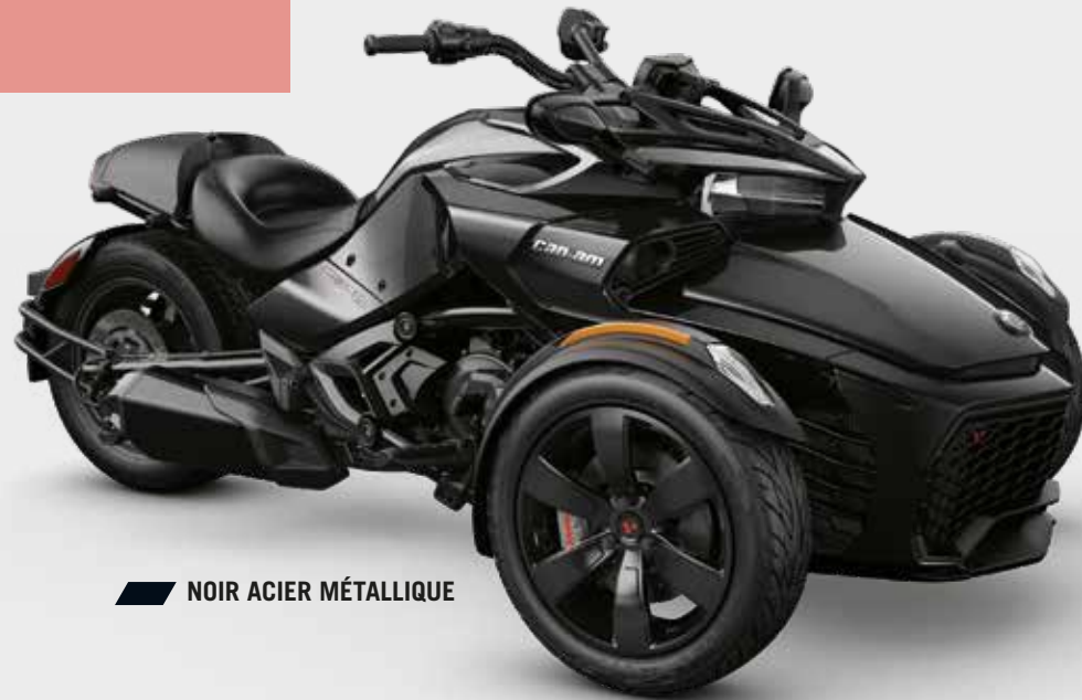
NOIR ACIER MÉTALLIQUE